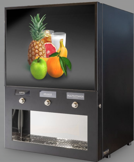
MODELL BIB 310 MA ST OB, RAL9005

Der Bag-in-Box Dispenser eignet sich optimal für jeden Ausstellungsort.