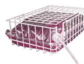
Gitterkorb für Schlauchbeutel für den Einsatz von losen Schlauchbeuteln ohne Kartonage Art.-Nr. 1001308 (Lieferung ohne Schlauchbeutel)