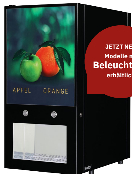
MODELL BIB 210 EA DT, RAL9005